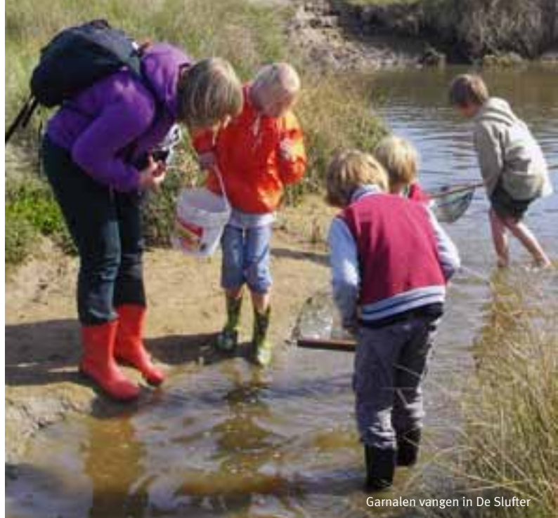
Garnalen vangen in De Slufter

Wil je niet in de boot genomen worden, maar doe je wel mee met de barbecue op vrijdag 18 mei a.s. wil je dat dan ook even melden voor