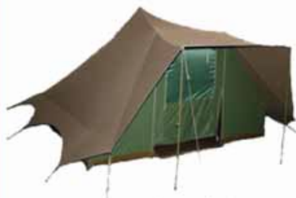
Het showmodel is vanaf heden te bezichtigen in Amsterdam & Nieuwegein

Hij is terug!! De Poolster van Carl Denig is in een modern jasje gestoken om het 100-jarig jubileum te vieren. Dit icoon dat stamt uit de jaren 50 is nu van alle gemakken voorzien en wordt nog steeds in Nederland gemaakt!